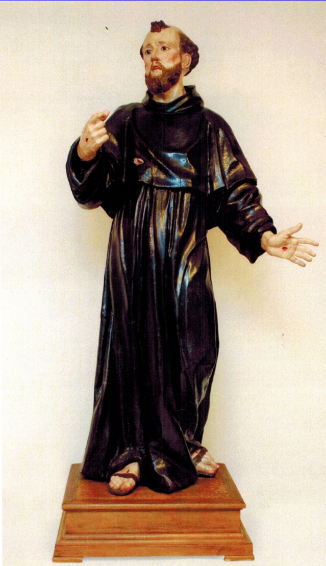
GIACOMO COLOMBO e AIUTI (attr.), San Francesco d'Assisi, fine XVII-inizi XVIII sec., legno policromo, h 150 cm ca, Barletta, Buon Pastore

La nostra "visita" virtuale alle tracce iconografiche sanfrancescane sparse per tutta la Puglia ci conduce stavolta in quel di Barletta alla scoperta di una poco nota scultura raffigurante il nostro Santo, conservata da alcuni decenni nella recente chiesa parrocchiale del Buon Pastore, ma con ogni probabilità proveniente dall'altra chiesa barlettana di Sant'Antonio di Padova, adiacente allo storico convento dei Frati Minori Conventuali (e infatti il Nostro è qui rappresentato con l'abito dell'Ordine; il cingolo, in lana, è stato rimosso nel corso dell'ultimo intervento di restauro). Ci troviamo di fronte a una tipica testimonianza del multiforme influsso culturale esercitato in età moderna dalla capitale, Napoli, in ogni provincia del Regno, e in particolare in ogni genere di arte figurativa. Tra questi, appunto, la statuaria lignea, che riempie di statue e busti (caratteristici e un tempo assai diffusi i "busti-reliquiario") di santi quasi ogni più remota chiesa meridionale, talvolta di carattere poco più che