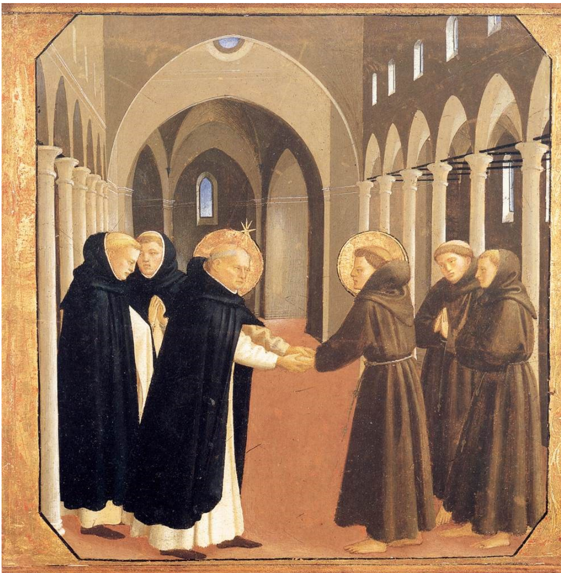
GUIDO DI PIETRO detto FRA GIOVANNI DA FIESOLE detto BEATO ANGELICO, Incontro di san Domenico di Guzmán e san Francesco d'Assisi , 1434-1435, tempera e oro su tavola, 27 x 26 cm, San Francisco, Fine Arts Museums of San Francisco