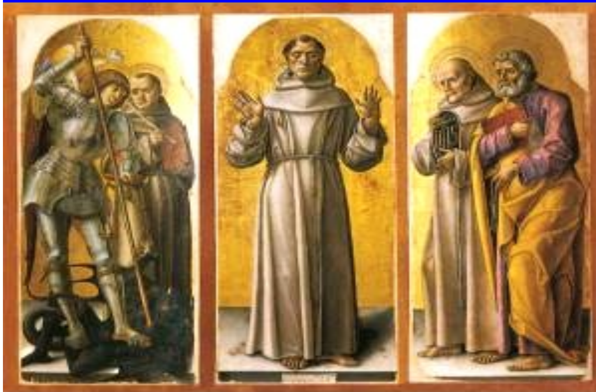
BARTOLOMEO VIVARINI, Trittico con San Francesco d'Assisi tra i santi Michele Arcangelo, Antonio di Padova, Bernardino da Siena e Pietro Apostolo , 1483, tempera su tavola, 116 x 151 cm, Bari, Pinacoteca metropolitana «Corrado Giaquinto».

Notiziario della Provincia di Puglia dei Santi Nicola e Angelo dei Frati Minori Conventuali